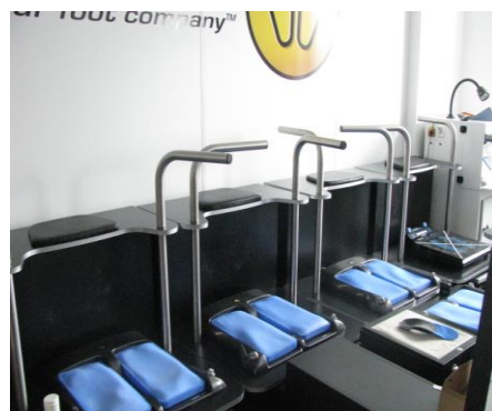
シダス フランス本社トレーニングセンター